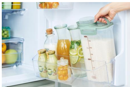
取っ手付き。縦置き収納。

お米は10℃以下で保存すると酸化しにくいといわれています。冷蔵庫内は温度や湿度が一定で日光にも当たらないため、お米の保存に最適です。スリムな形状で冷蔵庫のドアポケットにもぴったり。さらに横置きもできる設計なので、冷蔵庫のちょっとしたスペースにもスッキリ収納できます。