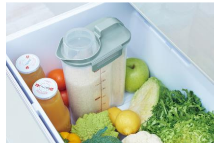
野菜室保存で旨み長持ち！