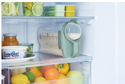
庫内で寝かせてもOK。