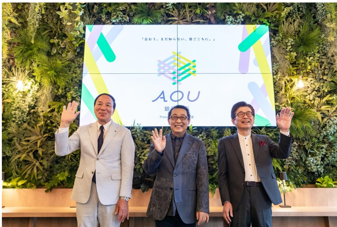
緑あふれる時間制カフェラウンジ「AOU 銀座の森」がオープン！

三信住建株式会社(所在地:中央区銀座/代表取締役社長:信田 博幸)は、「会おう。まだ知らない、居ごちに。」をキャッチフレーズに、緑あふれる時間制のカフェラウンジ「AOU 銀座の森 (アオウ ギンザノリ)」を2023年6月5日(月)よりオープンいたしました。オープン当日のプレスプレビューには、シンガーソングライターのさだまささんがゲストとして登場。今なぜこのスペースをオープンしたのか、なぜここで「会おう(AOU)」なのか。緑あふれる店内、和やかな雰囲気で開催されたイベントの様子をご紹介します。