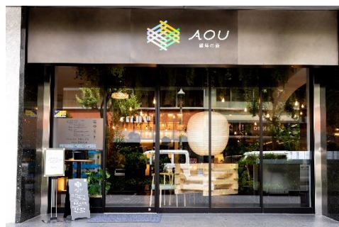
ロゴデザインはキャンプファイヤーをイメージ

事前登録や予約は不要で、いつでも気軽に立ち寄っていただけます。入り口にあるタブレット端末からQRコードを読み取りチェックイン、初回30分750円の施設利用料を払えば、一部有料メニューをのぞき、ドリンク類、スイーツなどがフリーで召し上がっていただけます、とのこと。また、一部商品はテイクアウトも可能です。