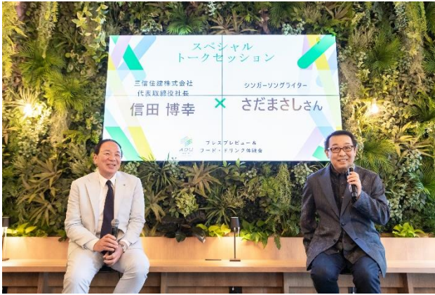
トークセッションではさだまさしさんが登場

トークセッションでは、オープンのために応援に駆けつけてくださったシンガーソングライター・さだまさしさんが登場。