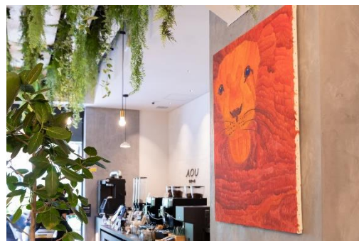
店内には福祉施設の子供が描いた感性溢れる絵画も。

弊社の本社が入るこのビルの一階が空いたと聞いた際、今、社会に対して何ができるか、従業員に対しても、このコリドー街の入り口にあるこの場所で、できることは何か、そんなことを考え、試行錯誤してたどり着いたのが「AOU 銀座の森」でした。この場でいろいろな人が出会い、交錯し、化学反応が起こるような、そんな魅力的な空間を作ろうと。皆さんの後ろの壁にライオンの絵が飾ってあります。福祉施設の子供が描いた個性的な色使いの絵です。人は誰もそれぞれの才能がある、健常者も含め世の中のいろいろな人がかかわりあうことで、素晴らしい化学反応が起こるのではないかと、そんな期待を抱いております。