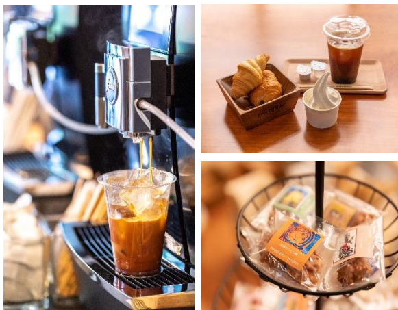
コーヒー、クッキー、パン、ソフトクリームが楽しめる。

薫り高い自家焙煎珈琲をはじめ、国産小麦を使用したパン、マフィンなどの焼き菓子など、どれもとてもおいしそうです。福祉支援団体を介して仕入れた福祉工房の手作りクッキーもあり、ハンディキャップを抱えた方が社会とつながり働く喜びを感じながら心を込めて作ったお菓子を提供しています。そして、北海道産の生乳を使用した濃厚なソフトクリームまで、子どもから大人まで楽しめるこだわりのメニューが揃っています。