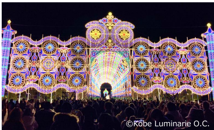
メリケンパーク会場 幅51mにわたる玄関作品「フロントーネ」