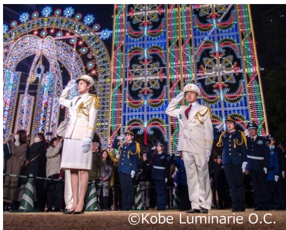
消灯式で敬礼する日本管財警備員