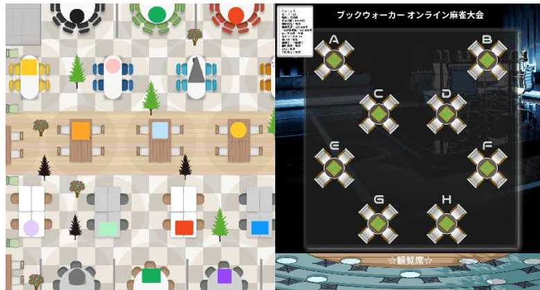
▲バーチャルオフィス上に麻雀卓をセット。 組み合わせで選ばれた4名が各麻雀卓に集い、麻雀ゲームで勝負をしながらコミュニケーションを楽しみます。