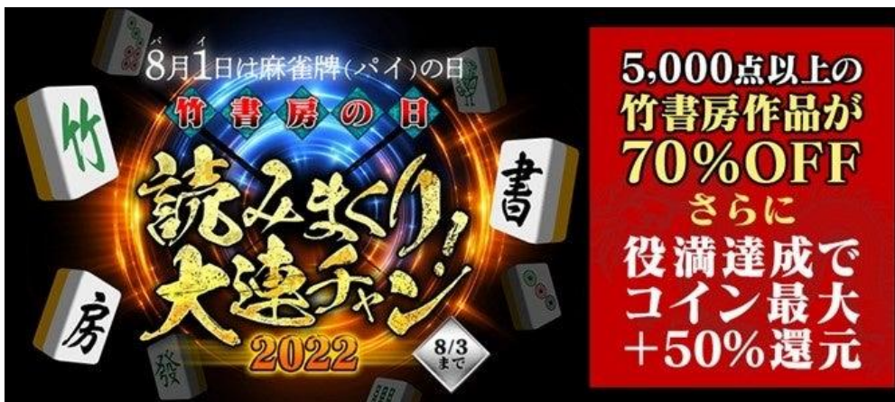
▲現在は終了しているキャンペーンです。 当時は「裏ドラ」対象作品が設定され、当該作品を購入した人には後日さらにコイン還元を行いました。

総合電子書籍ストア BOOK☆WALKER は、オリジナルのキャンペーンも魅力の一つです。 なかでも、2022年に実施した麻雀を題材にしたキャンペーンは、購入条件に応じて「役」を作り、達成した「役」と購入額に対してコインを還元するもので、ユーザーの皆様より反響の大きいものでした。