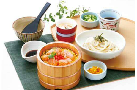
サーモンいくら丼膳 1,899円(税込2,088円)