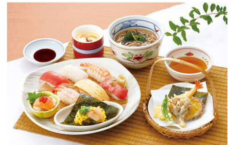
季節のすし和膳<秋> 1,599円(税込1,758円)