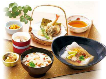
松茸ご飯とすだちそうめん膳 1,599円(税込1,758円)