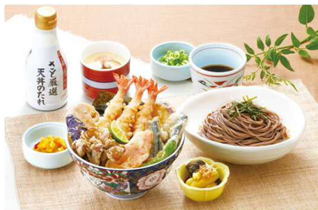
すだち香る秋の味覚天井御膳 1,499円(税込1,648円)