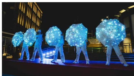
ナイトショー（昨年の様子）

このショーはテクノロジーをパフォーマンスに融合させ、伝統ある日比谷という場所で未来を予感させます。パフォーマンスと最先端の技術を同時に体験できる「観る」だけに留まらないエンターテインメントの挑戦をぜひ体感してください。