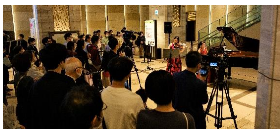
まちなか劇場（昨年の様子）

Hibiya Festival 2024 に先立ち、「あなたがNEXTアーティスト～若手応援プロジェクト～2024」と題して、2023年11月から様々なジャンルの若手アーティストを公募してきました。演出家宮本亜門さんから11名のプロフェッショナルが審査員となり選出された11組の「NEXTアーティスト」たちが、特別なパフォーマンスを披露します。街とエンターテインメントの融合をお楽しみください。