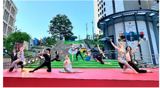
ステップショー（昨年の様子）

日比谷ステップ広場に大型ステージを設け、様々なジャンルの本格的なエンターテインメントを無料で楽しめる劇場のショーケースです。日比谷で人気のミュージカルやオペラに加え、ダンス、音楽など様々なジャンルのエンターテインメントのプロフェッショナル達がステップ広場に集結します。普段は劇場の中でしか観ることができないパフォーマンスをオープンエアの空間で、無料でお楽しみいただけます。