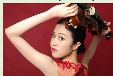
和久井 映見 (ワクイ エイミ)