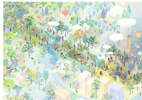
森から都市までのつながりを表現した展示空間 (イメージ)

出展団体：株式会社イトーキ、エステー株式会社、株式会社大林組、 カリモク家具株式会社、神宮外苑地区まちづくり、ソニー株式会社、 ダイキン工業株式会社、株式会社竹中工務店、東京都、 トヨタ自動車株式会社、株式会社日建設計、 西尾レントオール株式会社、株式会社乃村工藝社、 パナソニックグループ、三井物産株式会社、三井不動産株式会社、 三井ホーム株式会社、株式会社 MUJIHOUSE、株式会社良品計画