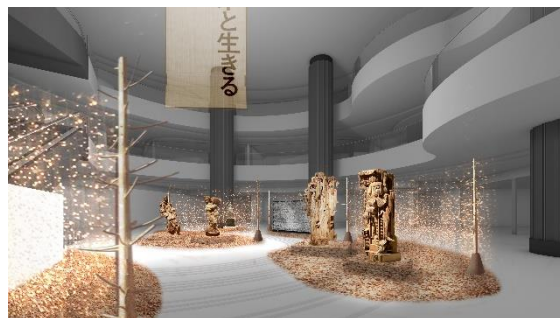
イントロダクションエリア (イメージ)

「木と生きる」をテーマにした本イベントを象徴する空間として、東京ミッドタウン日比谷 1F アトリウムにイントロダクションエリアの空間を演出。木彫作品のインスタレーションと本イベントのイントロダクションからなる空間を設けます。香りや音、光を背景に五感で体験ください。