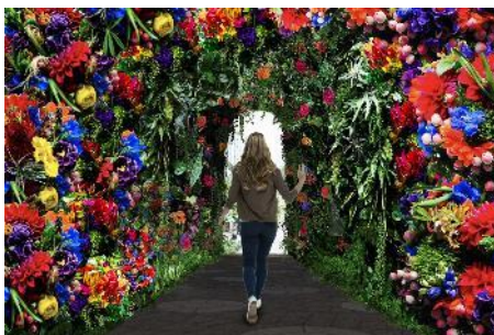
「Flower Dome」外観（写真上）、内観（写真下）