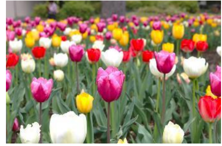
チューリップ開花イメージ

タイトル：HIBIYA BLOSSOM in Hibiya Park 場所：日比谷公園 大噴水前花壇、第一花壇 等 実施期間：2024年3月20日（水・祝）～4月上旬ごろ ※場所・期間は開花状況により異なります 主催：東京都公園協会