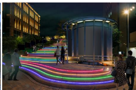
階段ライトアップイメージ