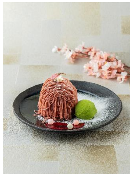
春メニューイメージ