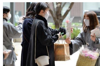
花の無料配布 (イメージ)