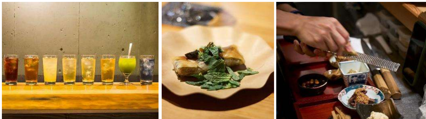
▲左から「茶割 BAR TRUCK」「中むら食堂」（イメージ）

誰もが楽しめて、多様な人と出逢えるボーダーレスな呑み場、「角打ち」。八重洲夜市では、気軽に楽しめる角打ちスタイルの飲食エリアが登場します。ドリンクは、お茶割りのパイオニアとして話題の人気店「茶割」が、期間限定で「茶割 BAR TRUCK」をオープン。フードは、感度の高い食通たちに絶大な支持を得た「Salmon & Trout」や「八雲茶寮」を経て、現在はフリーのシェフとして活躍の中村拓登氏率いる「中むら食堂」がメイン店舗を担当。八重洲夜市をイメージした限定メニューもご用意いたします。