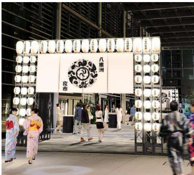
八重洲夜市イメージ