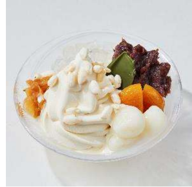
▲左から、EN VEDETTE LUXE / かき氷コレクション・バトン / TASU+