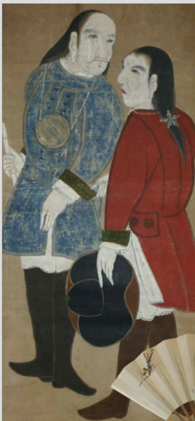
大黒屋光太夫磯吉画幅(大黒屋光太夫記念館蔵)