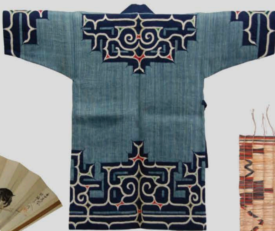
アットウシ(樹皮衣)