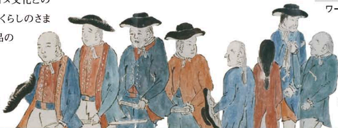
漂流人帰国松前堅之図

本展覧会では、このような18~19世紀に活躍した三重県(伊勢国)出身の人物とアイヌ文化との深い関わりを紹介するほか、アイヌの暮らしのさまざまな道具や、現代の作り手による作品の数々を展示します。