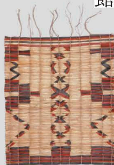
ボンチタラペ (花ござ)