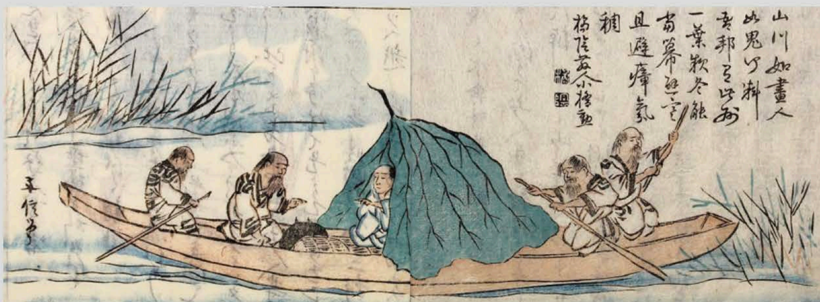
「石狩日誌」(松浦武四郎記念館蔵)