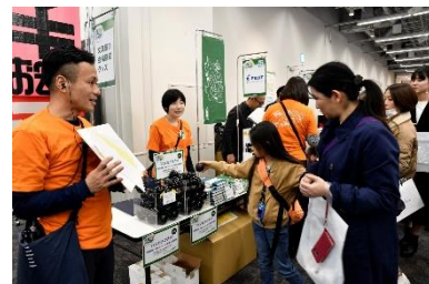
販売会 (イベント当日限定品の用紙柄ハンカチガチャ)

「書く」ための道具を中心とした人気文具メーカー31社が参加する販売会では、当日限定販売品や新商品、そして先行販売商品をご用意いたしました。イベント当日限定商品は、「用紙柄ハンカチガチャ」の原稿用紙柄が好評で、複数購入される方も多数いらっしゃいました。色鮮やかな100色インクを手にとったり、ガラスペンの試し書きをするなど普段店舗ではできないことも体験していただきました。