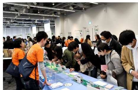
試し書きコーナー