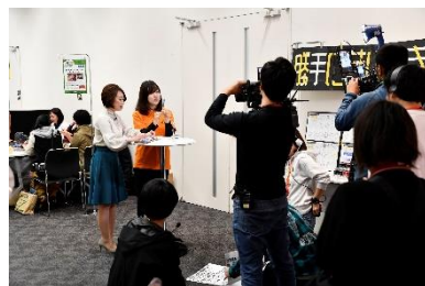
CHECKライブコマース撮影

今回、初めて東急ハンズのバイヤーによる「文具のライブコマース」を実施いたしました。ライブ配信で商品を紹介する新感覚アプリ『CHECK』のコメント機能を通じて「ヨシタケシンスケさんのクリアホルダー」を紹介したところ、いいねが殺到し、アプリ上でたくさんのフォロワーに商品を購入していただきました。気になった商品は動画視聴しながら簡単に購入できるとあり、商品の良さやこだわりを存分にお伝えさせていただきました。