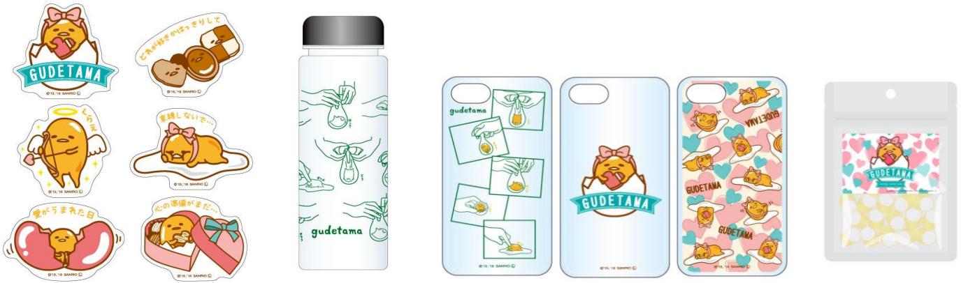
▲ステッカーシール(全6種) 各 300 円(税抜)