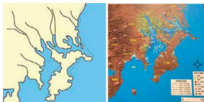
図1 図2 千葉県域が島に近い状態だった数千年前（縄文時代中期）の形状を採用。 長い年月を経て、現在の千葉県が形成されていった。