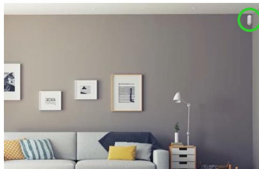
モダンなインテリアになじむデザイン