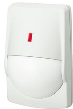
現行モデル RXシリーズ