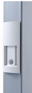
駐車場用車両検知センサ「ViiK Cell（ビーク・セル）」

多くの駐車場における車両検知は、金属物体を検知するループコイルを路面下に埋設しています。しかし、施工時に地面を掘り起こす作業、アスファルト舗装や配線などの大掛かりな作業が必要であり、メンテナンスにも時間と費用を要します。近年、床面の防水性の確保、構造物保護の観点から商業施設やビルの地下駐車場などにおいてループコイル埋設禁止の動きが進みつつあります。