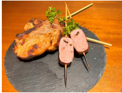
豚スペアリブ／豚フィレベーコン巻き