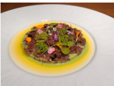
マグロのタルタル

クラシックなフレンチ料理やアラカルトメニューも用意。その他、串焼きを取り入れたコース料理なども可能です。