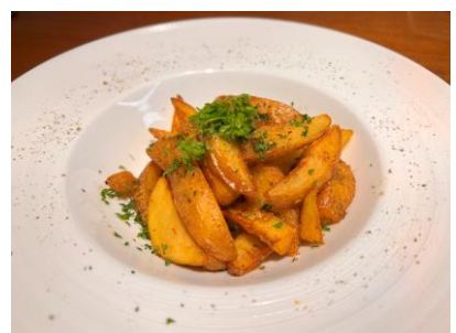
アンチョビポテト