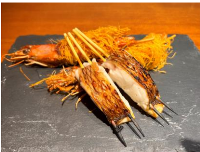
赤エビのカダイフフリット／鮮魚の炭火焼き