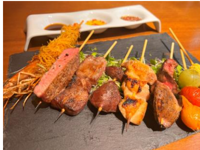
おまかせ8種盛り（3,080円）