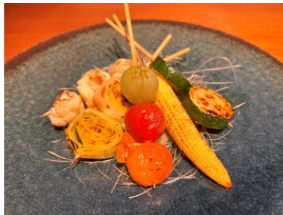
カリフラワー／ポロ葱／ミニトマトなど