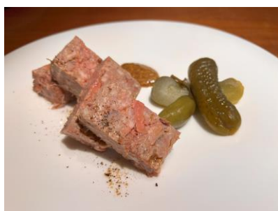
パテ・ド・カンパーニュ