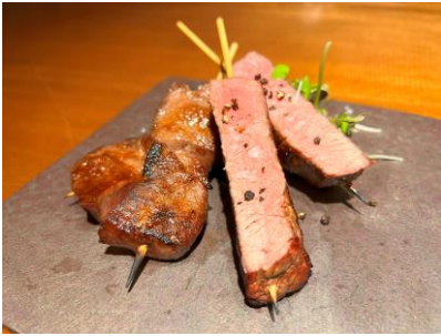
仔牛タン／牛サーロイン