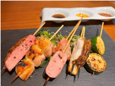
おまかせ5種盛り（1,870円）