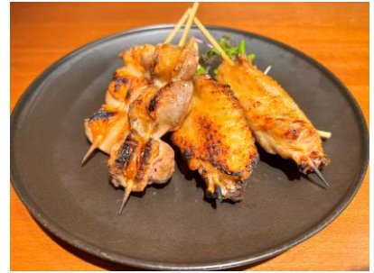
薩摩地鶏のもも／薩摩地鶏の手羽