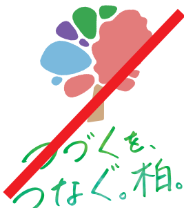
色の配置を変更したり、新たな色を追加してはならない。