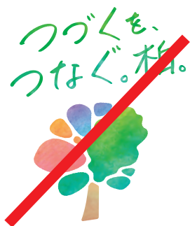
要素の位置関係を変更しない。

形状を変更したり、ロゴマーク周辺の余白を守らず使用することを禁止しています。 また、下記のような使用にならないようにも十分注意してください。