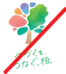
要素の比率を変更しない。