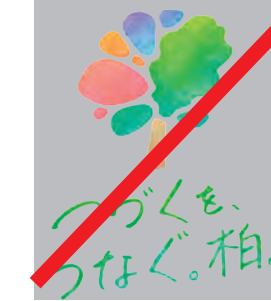
濃い背景の上で使用しない。 ※白背景をひいて使用は可能です。 P12 参照ください。