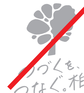
指定の濃度を変更しない。