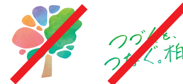
ロゴマーク、ロゴタイプは単体で使用しない。