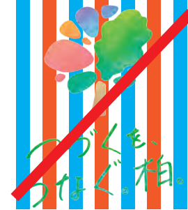
複雑な色彩やパターンの上で使用しない。