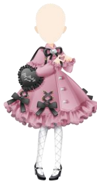
真夜中のマイメロディワンピース