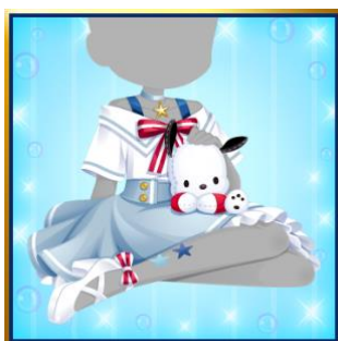
ポチャッコのセーラーマリン