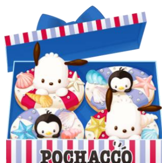
ポチャッコマリンドーナツ