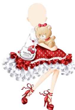
ハグっと☆タイニーチャム