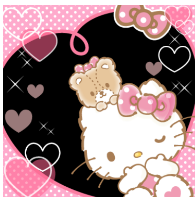
My nice pal ☆ハローキティ&タイニーチャム