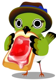
イーティング ダニールグ イス