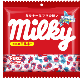
ミルキーウォール

(コラボアイテム一部紹介)