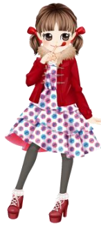
ペコちゃんミルキーコーデ