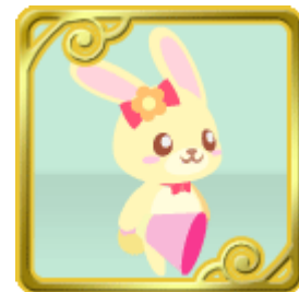
ミルクィちゃん (動物)

enish では、Link with Fun というスローガンのもと、「世界中に enish ファンを作り出す」ことをミッションとして掲げ、より多くのお客様に楽しんでいただけるよう魅力的なサービスの提供に取り組んでまいります。