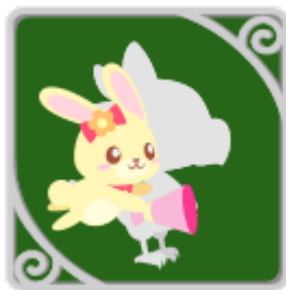
抱きつきミルクィちゃん (着せ替え)