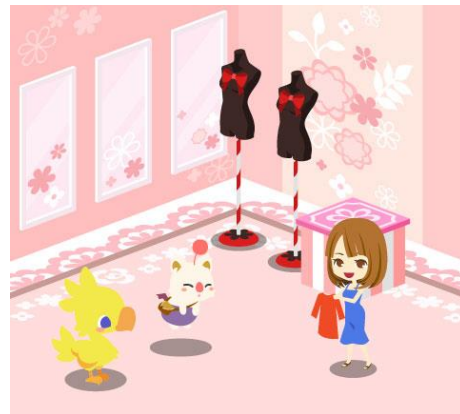
パタパタモーグリ (インテリア)