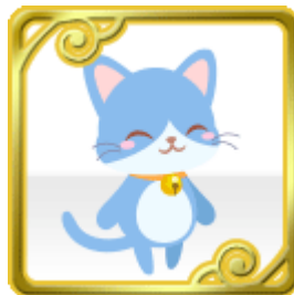
チェルシーくん (動物)