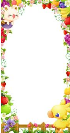
チョコボのフルーツフレーム (アバター)