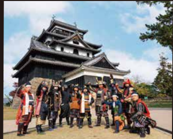
まつえ時代案内人とまつえ若武者隊