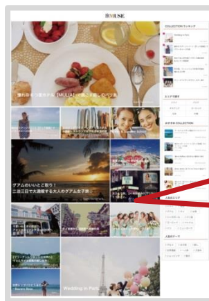
<スマートフォン トップイメージ>