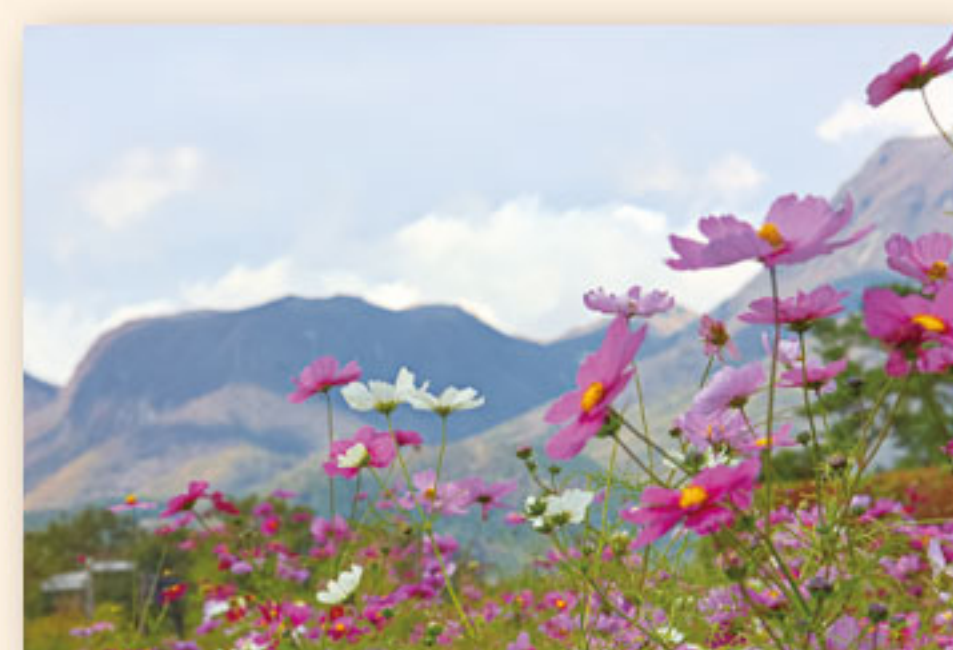
10月上旬~10月下旬 コスモス 9月~11月 センニチコウ、ペコニア