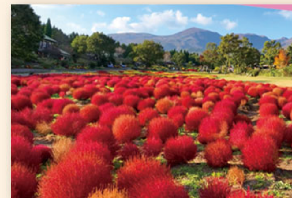
9月下旬~11月上旬 コキア