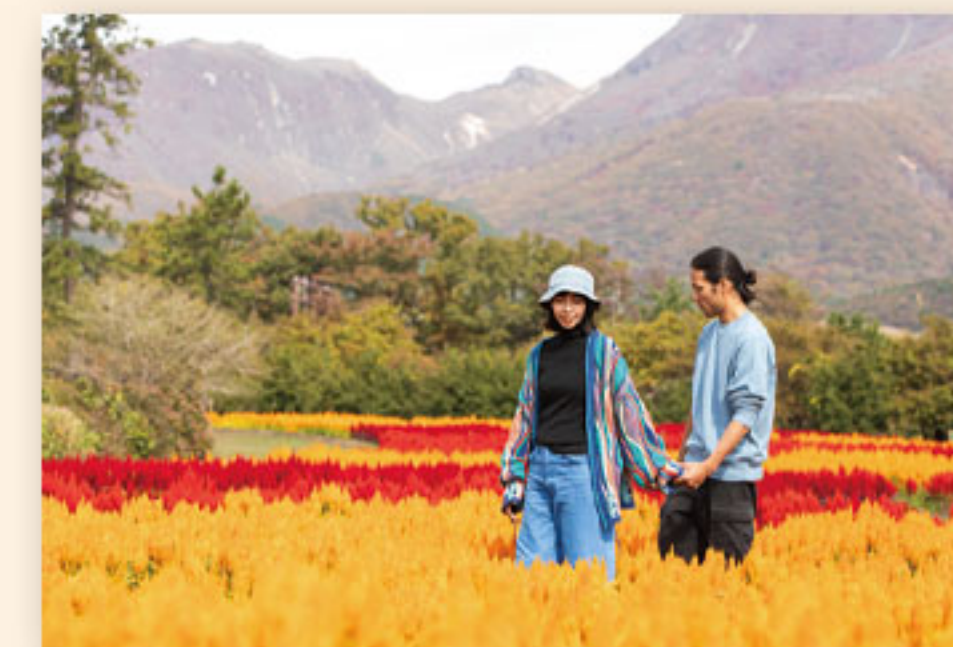
9月下旬~11月上旬 ケイトウ