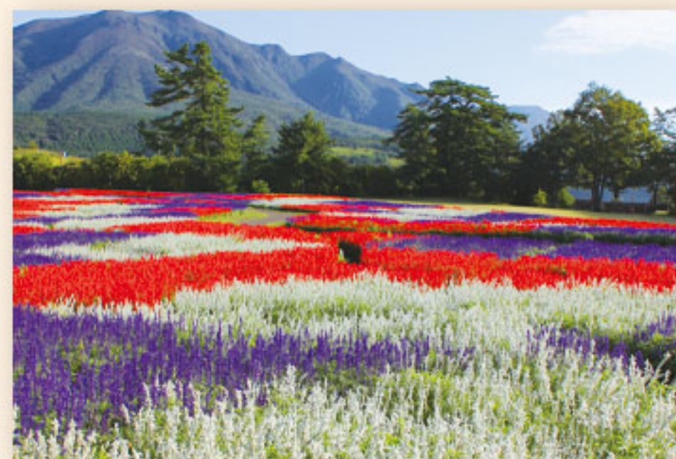
9月中旬~11月中旬 サルビア

黄金色に輝くマリーゴールド、鮮やかな赤や黄色のケイトウ、風に揺られるコスモス、紅のコキア、赤や白、青の鮮やかなコントラストが印象的なサルビアなど、色とりどりの花々が咲き誇り、大自然に溶け込んだ色彩のじゅうたんが目前に広がります。