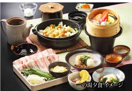
一の湯夕食イメージ