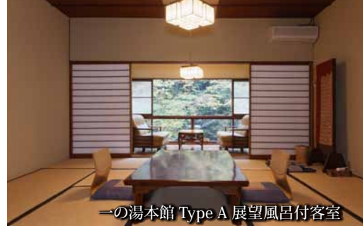
一の湯本館 Type A 展望風呂付客室