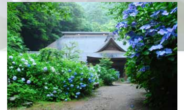
塔ノ沢あじさいスポット「阿弥陀寺」