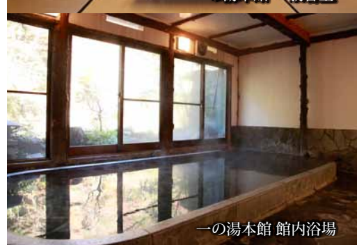
一の湯本館 館内浴場

※ご予約は、ご宿泊日7日前までお願い致します。璦珞(ようらく)お食事付プランとお伝えください。