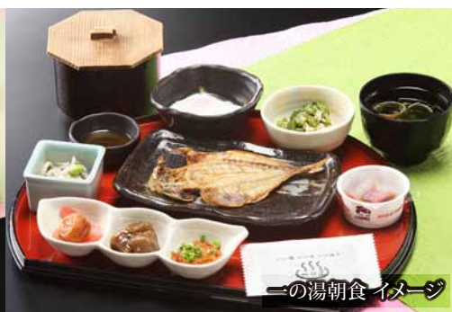
一の湯朝食イメージ