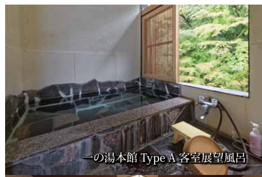
一の湯本館 Type A 客室展望風呂