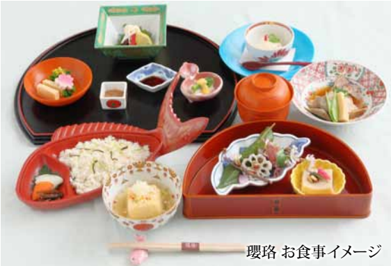
璦珞 お食事イメージ