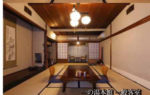
一の湯本館 一般客室