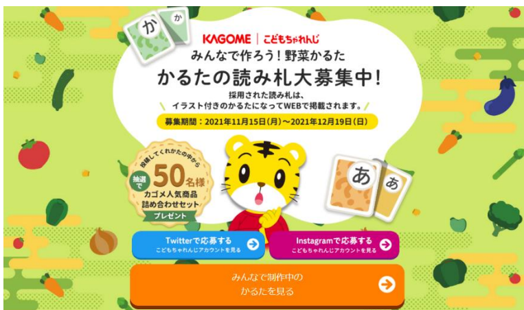
「みんなで作ろう！野菜かるた」特設サイト

ベネッセとカゴメは今後も、両社の協力のもと、様々な形で子どもの食育に取り組んでまいります。