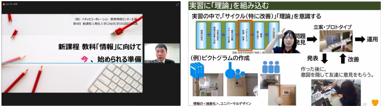
(今回開催されたオンラインセミナーの様様)

ベネッセでは、新課程でスタートする「情報Ⅰ」について、どう理解し、どう準備すればよいかなどについて整理した高校教員向けオンラインセミナーを7月までに3回実施しております。