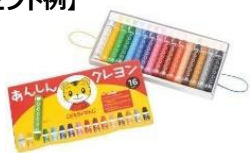
▲しまじろうグッズ