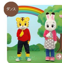
おおきなうりのきのしたで