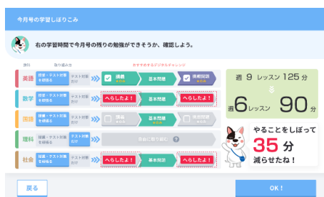
毎週の個別学習プラン

「進研ゼミ」では、今後もデジタル化、個別化対応を通じて中学生の学習支援に力をいれてまいります。