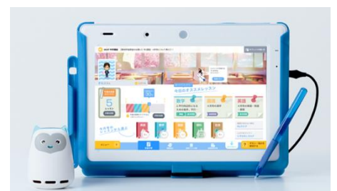
AI 学習アシスタント