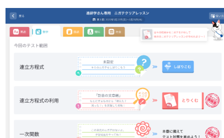
ニガテクリアレッスン