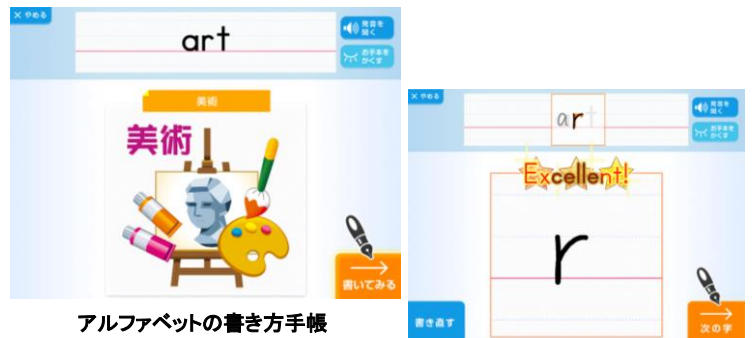
アルファベットの書き方手帳 専用ペンで直接画面に書いて 練習することができます。

進研ゼミ専用タブレットを使った〈ハイブリッドスタイル〉では、専用のタッチペンを使い「見て」「聞いて」「書いて」の学習はタブレットを中心にしながら、赤ペン先生の問題やテスト教材など、記述の必要性が高いもの、一覧性が求められるものについては、従来の紙で提供することで、学習のインプットとアウトプットをバランスよく行きます。