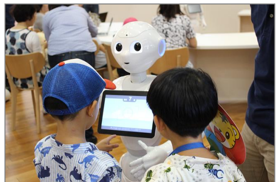
【7月にエリアベネッセ青山にて実施した Pepper 体験イベントの様子】