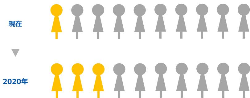
「新卒エージェント」サービス普及率（当社推計）

転職市場では広く受け入れられているエージェントサービスですが、新卒市場での利用者（サービス登録者）は現在、約 10%にとどまります。DODA新卒エージェントでは、学生へのサービス認知向上を行い、2020年には、新卒市場において約 30%の就活生が利用するサービスへの拡大を目指します。