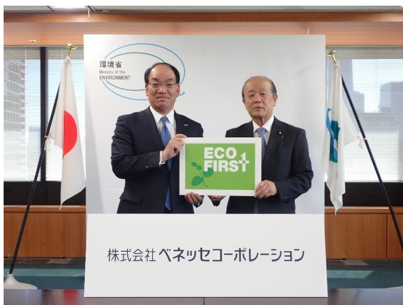
認定式の様子（写真左：株式会社ベネッセコーポレーション 代表取締役社長 小林仁、右：環境副大臣 八木哲也氏）

株式会社ベネッセコーポレーション（本社：岡山県岡山市、代表取締役社長：小林 仁、以下：ベネッセ）は、2024年4月10日、環境省の「エコ・ファースト企業制度」において、新たに「エコ・ファースト企業」に認定されました。