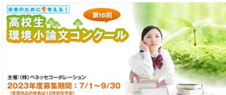
↑：昨年度開催した高校生向け環境小論文コンクールの募集バナー

▶教材を通じた環境教育事例の詳細： https://benesse-hd.disclosure.site/ja/themes/150