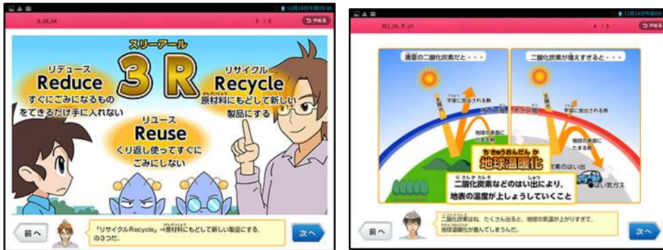
↑：小学4年生や5年生向けに環境を取り上げた教材の事例

また、「進研ゼミ」では、それぞれの学年に応じた内容で環境問題を教材内で取り上げたり、自由研究や小論文のコンクールを開催するなどの取り組みを通して、環境への取り組みの大切さを紹介し、行動を促す取り組みをしています。