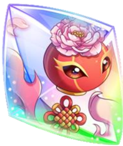
【ターロン】のコード ×100個