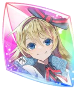
【夢のコード】アリス ～夢の姿～×60個

ベネッセとセガ XD はコラボレーションにより、両社の教育とゲーム（ゲーミフィケーション）の知見を活かし、子どもが楽しく学んで成長する機会を広げていくことを目指しています。