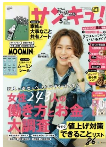
サンキュ！5月号 27周年号 (3月25日発売)