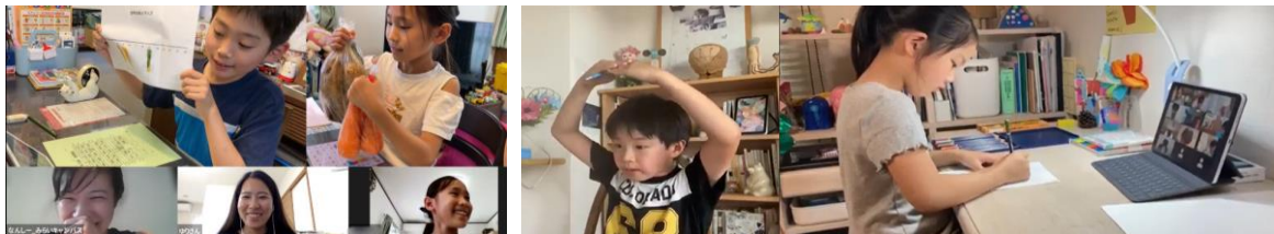
（上：レッスン受講中のイメージ）

講座お申し込みにあたっては、ポイント（1ポイント＝1円）を購入いただき、保持ポイントを利用いただけます。1講座は、全1～4回程度のレッスンから構成され、1レッスン（約40～60分）あたり、1,000～3,000ポイント程度のラインナップが多くなる予定です。