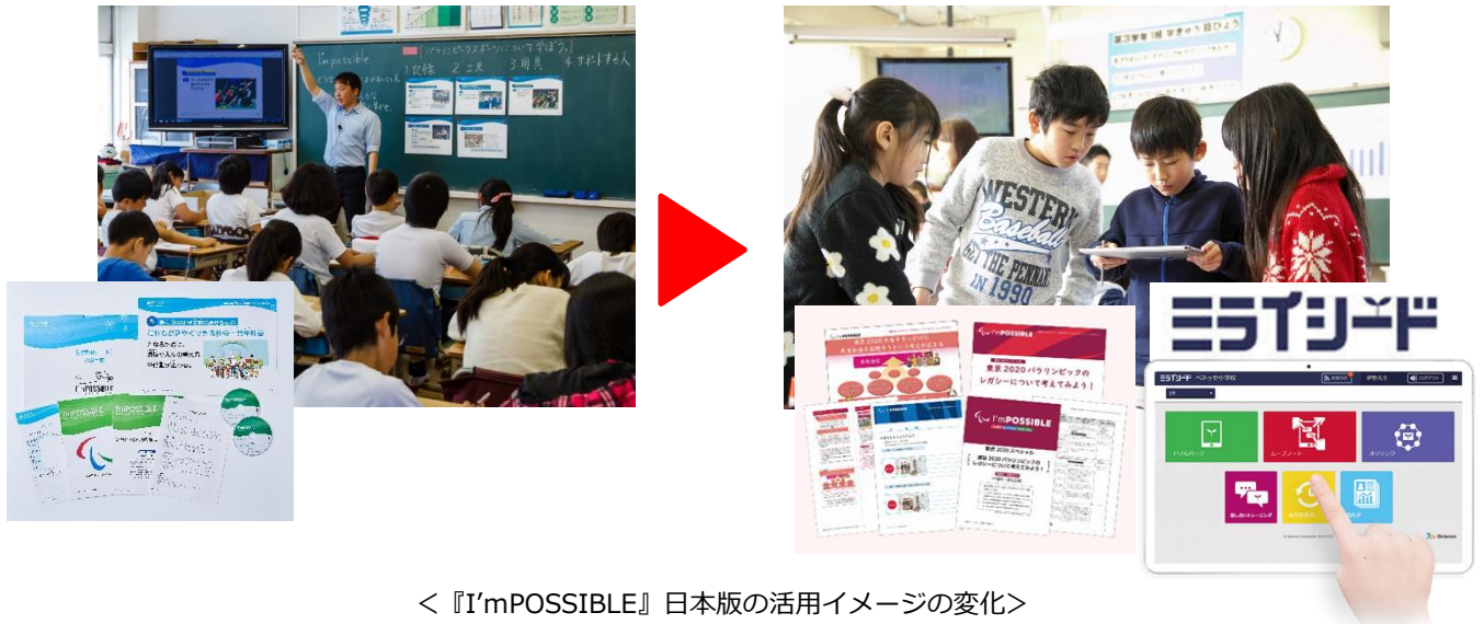
＜『I'mPOSSIBLE』日本版の活用イメージの変化＞

紙の教材からタブレット端末で授業展開が可能なデジタル化したテンプレート+指導案+素材へと進化