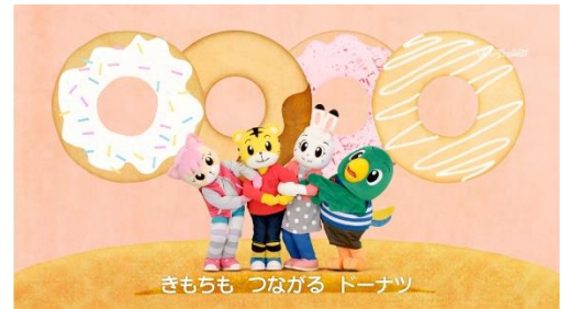
ドドドド ドーナツ（歌・ダンス）