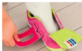
ダブルリング式のバックルとペロック機能