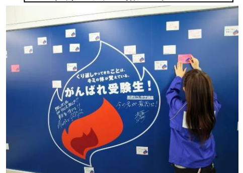
↑メッセージが貼られていく模様