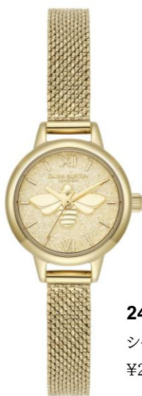
24000230 シャンパングリッター ¥28,600 (in tax)