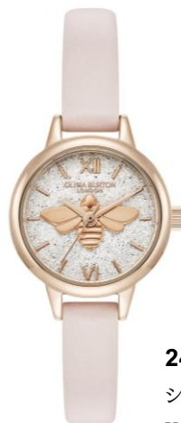
24000231 シルバーホワイトグリッター ¥26,400 (in tax)

ケース径：23mm / 厚さ：8.0mm / ケース素材：ステンレススチール / ストラップ素材：ステンレススチール、カーフレザー 風防：ミネラルガラス / ムーブメント：日本製クォーツ / 防水：3気圧