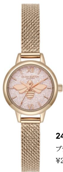
24000229 ブラッシュグリッター ¥28,600 (in tax)

春の訪れとともに、新しい始まりに幸運をもたらす「ラッキービーコレクション」。グリッターが美しく輝く文字盤には、オリビア・バートンの象徴的な蜂モチーフが繊細なエッチングで表現され、上品な華やかさをプラスしています。