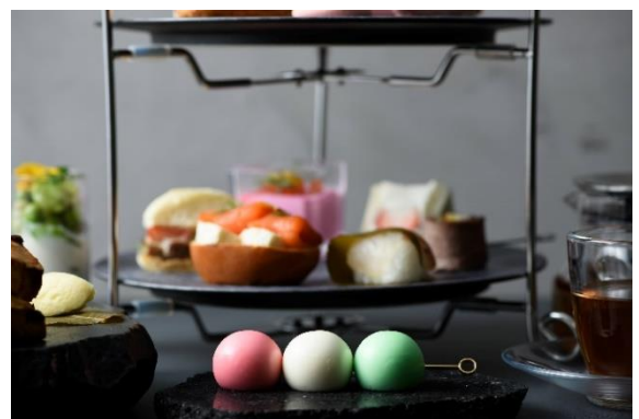
花見三色だんごムース