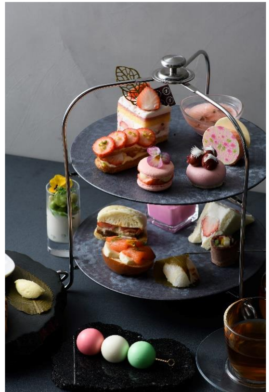
『Spring VIVARIUM Afternoon Tea』