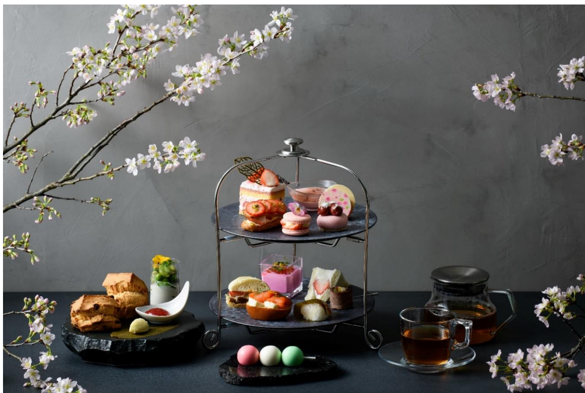
『Spring VIVARIUM Afternoon Tea』