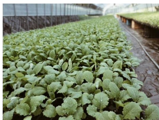
リサイクルした肥料で育った高菜