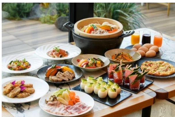
食のフェアのメニュー一例

また、食品リサイクルとして、ホテル内のレストランで回収した生ごみを廃棄物処理の企業で堆肥化し、それらを散布した畑で育てられた高菜をホテルのレストランで使用するという生ごみの循環型リサイクルも始動しています。さらに、食品廃棄量を測定する「Winnow (ウィノー)」システムを導入し、レストランで廃棄される頻度の高い食材の傾向を知ることができるようになりました。このことにより、食材の発注量の調整や、より食べ残しが少ないメニューの考案ができ、ホテル全体のフードロス削減につながっています。