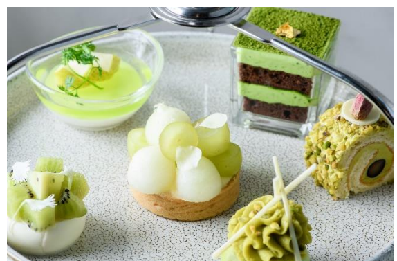
『グリーン・アフタヌーンティー』スイーツ