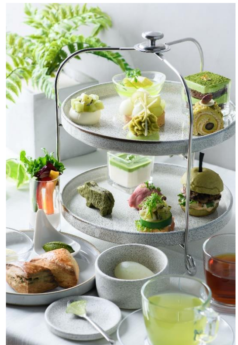
『グリーン・アフタヌーンティー』