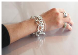
<はじめてのブレスレット>