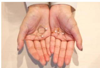
<はじめてのパール>