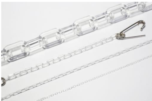
<安全ピン×アクリル>