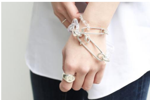
<安全ピン M&XL×リング M>