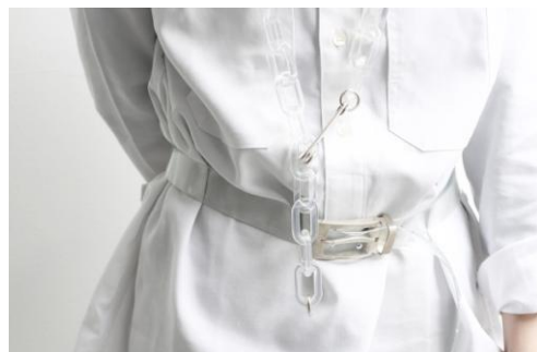
<安全ピン XL×ベルト C>