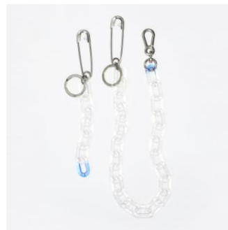
<キーホルダー/ウォレットチェーン>